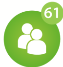
Mazie novadi Iedzīvotāju skaits <7000