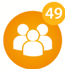
Lielie novadi Iedzīvotāju skaits >7000